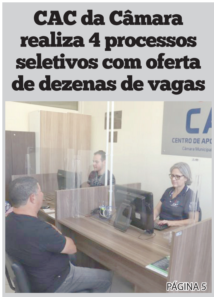
CAC da Câmara realiza 4 processos seletivos com oferta de dezenas de vagas